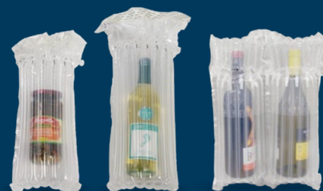
Botellas de vino y tarros de comida