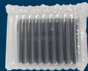
Laptops y electrónicos pequeños